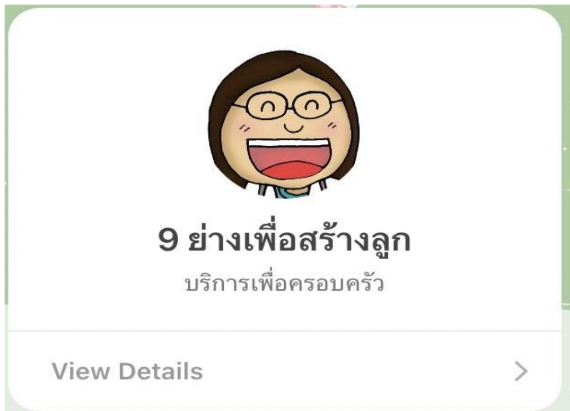
รูป Line 9 อย่างเพื่อสร้างลูก